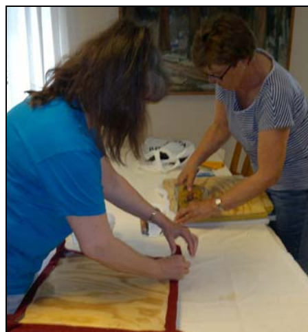
'Tapetserare' arbetar på församlingssvåningen