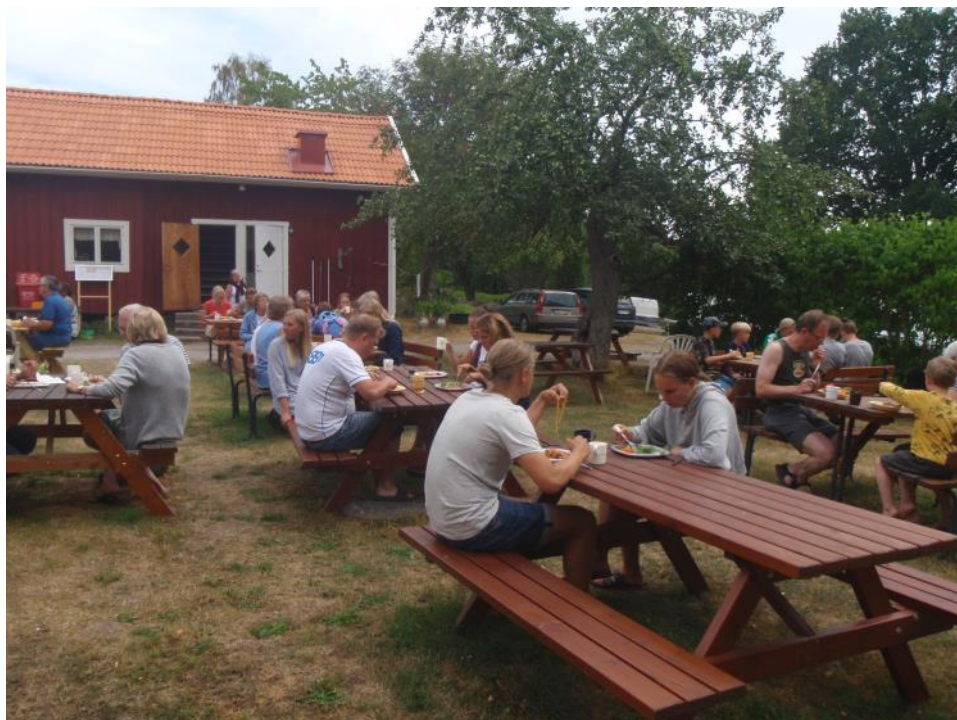
Matlaget till måndagens middag hade lyckats bra med spagetti och köttfärssås.