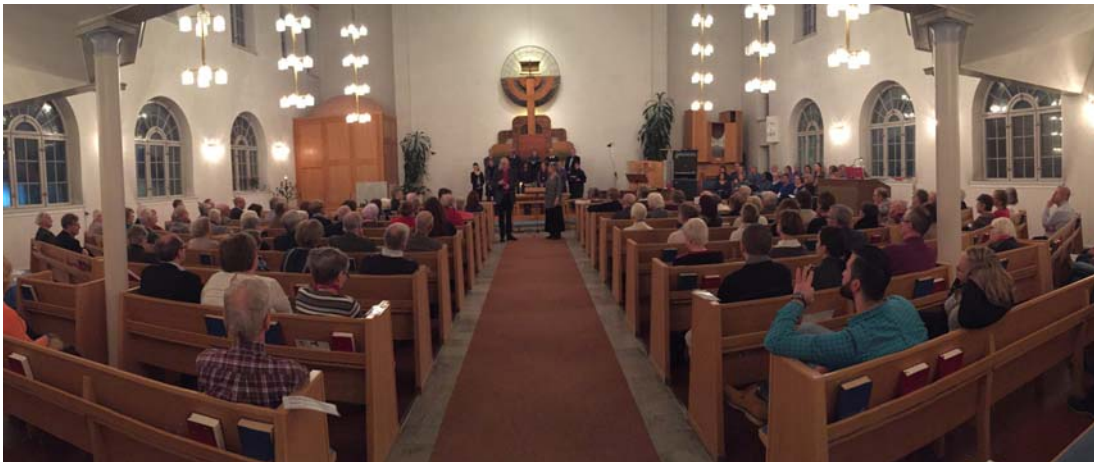
Biskopsbesöket fyllde kyrkan.