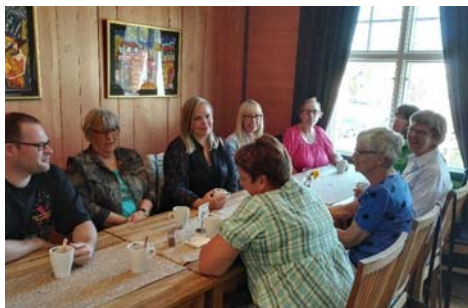
Personalutflykt till Tåkerns Naturum.