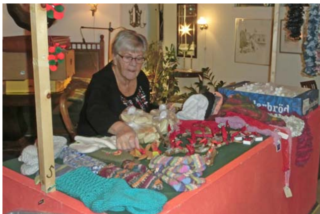
FVU:s julstuga 2015.

De flesta som kommer till FVU är pensionärer men alla åldrar är välkomna bara man tycker om att skapa saker och vill göra en insats