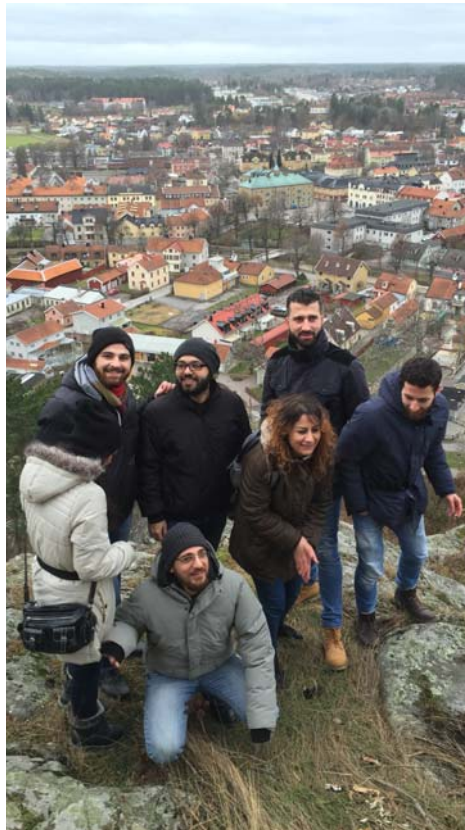
Högst upp!

Glöm inte anmälan till Församlingsresan till Väst- kustgården i Lerkil, 14-15 maj!