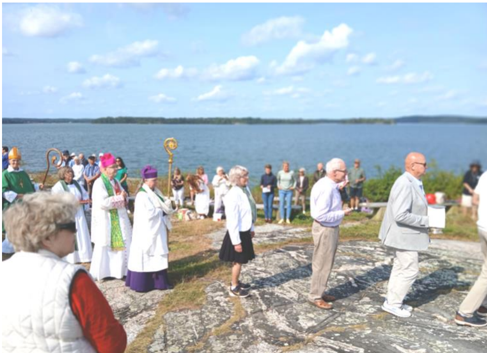
Ovan: Ekumenisk procession in till Capellet