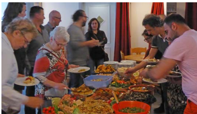
Våravslutning på språkcaféet.