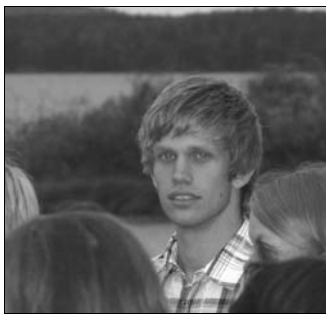
Avslutning på Sjövik.