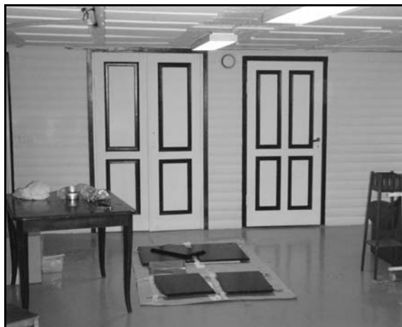
Källaren.