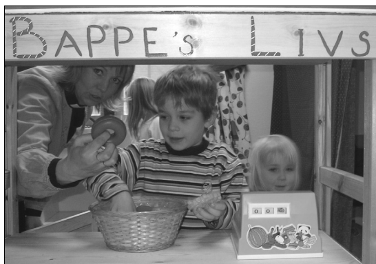
"Kom och köp!" – den nya affären i lekrummet inbjuder till mycket spontanlek.