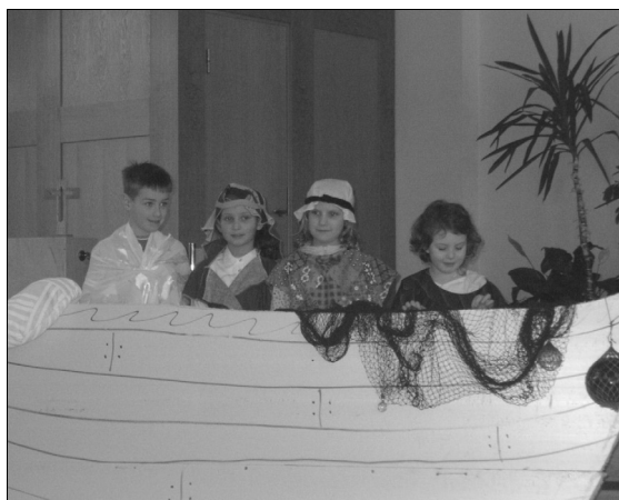
Jesus stillar stormen. Bild: Jonas Petersson.