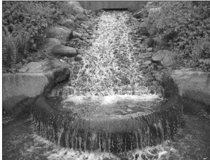
Porlande vatten vid fängelset.