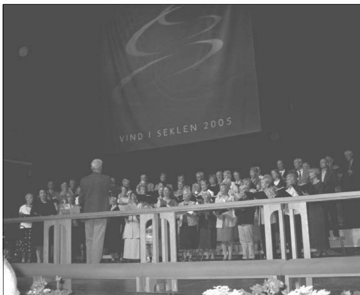
Över 60 sångare sjöng i konferenskören under ledning av Börje Ström och Bengt Gårsjö.