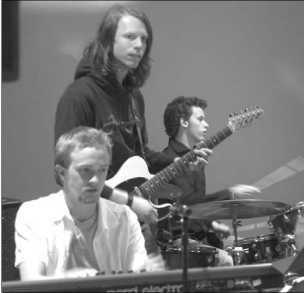
Under efterfesten "Minnesluckan" spelade bland andra konferensens husband.