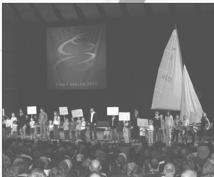
Barnkonferensen demonstrerade för roligare gudstjänster och fler läger.