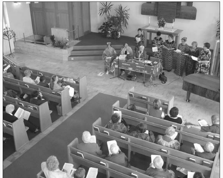
SBKF höll sitt årsmöte i Baptistkyrkan.