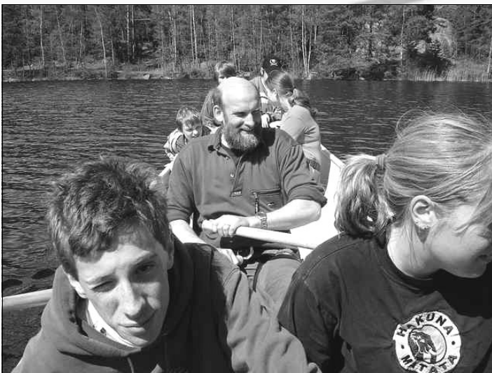
Tonårskonferensen var i Kolmården på äventyrsupplevelsen.