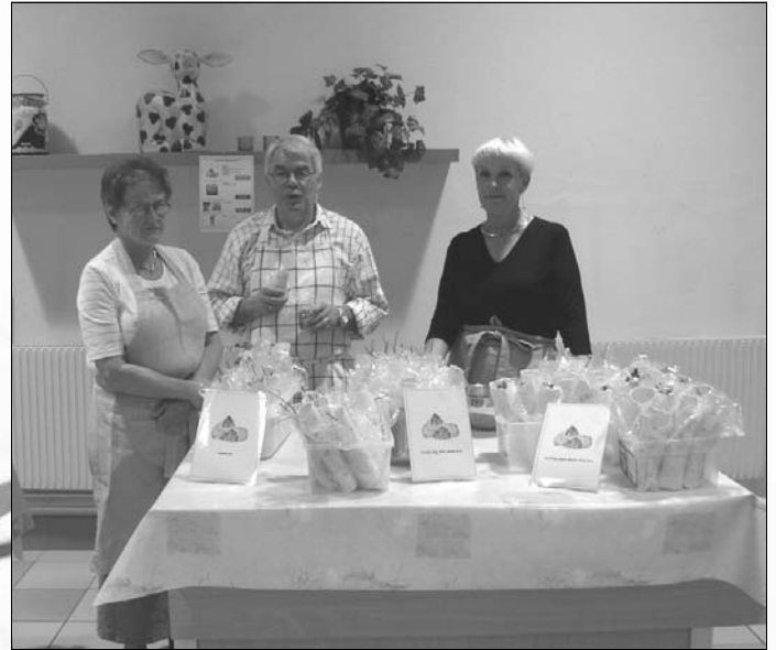
Vi serverades goda wraps och muffins.