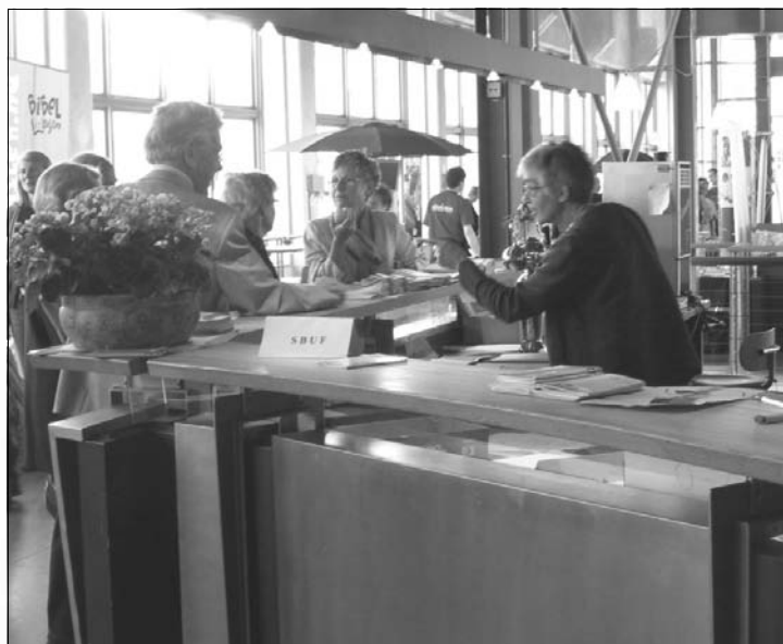
Cirka 550 människor registrerade sig som ombud och deltagare på SB- och SBUF-konferensen.