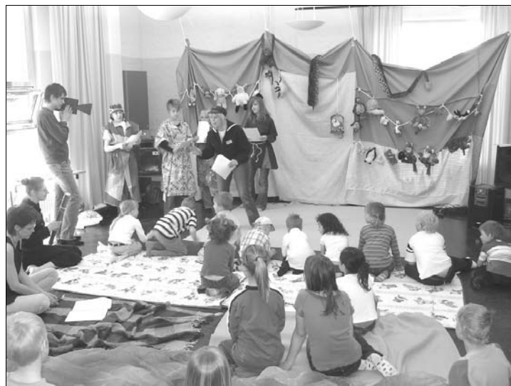
Storsamling på Löfteslandet under barnkonferensen.